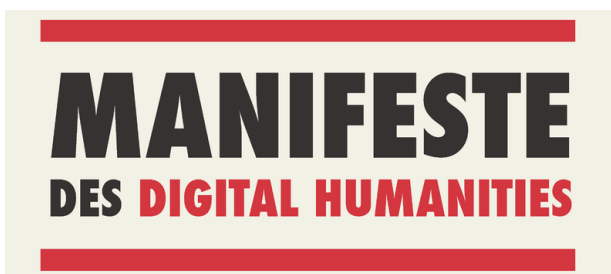
Figure 1: Example of a column-width figure Mikeal Coxous: Bandeau du Manifeste des Digital Humanities , public domain

Phasellus vel quam ullamcorper, laoreet dui id, faucibus eros. Sed gravida risus arcu, in porttitor ante tempus non. Donec vel dolor nibh. Nam porttitor molestie lorem in tristique. Maecenas pretium ante sem, in convallis metus hendrerit ac. Suspendisse scelerisque nibh lorem, et vulputate Pellentesque pellentesque felis, id sem pulvinar. Nulla rutrum pretium odio quis faucibus. Morbi vitae ex blandit, vulputate felis quis, semper leo. Curabitur quis odio mauris. Etiam porttitor dolor a erat auctor, at aliquet dui fringilla. Vestibulum vel pulvinar