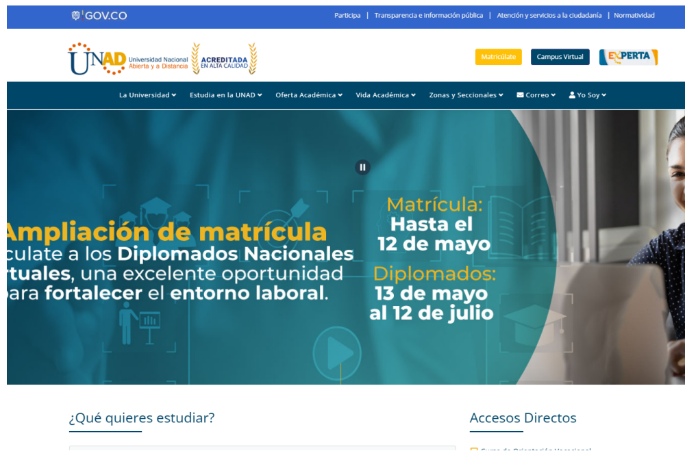
Figura 2. Ejemplo de Apéndice

Nota. Se hace una descripción del contenido del apéndice.