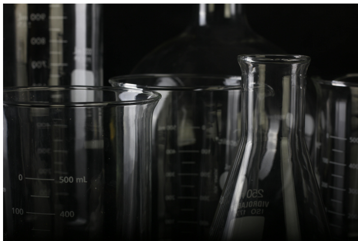
Figure 1: The caption is in font size 10 to separate better from the text. The images can be loaded from the images folder. By choosing the vspace value (e.g. -2 mm ), the picture can be moved up, the spacing between the image and the caption can be changed, and the space to the surrounding text below the caption can be adopted.

Lorem ipsum dolor sit amet, consectetur adipiscing elit. Ut purus elit, vestibulum ut, placerat ac, adipiscing vitae, felis. Curabitur dictum gravida mauris. Nam arcu libero, nonummy eget, consectetur id, vulputate a, magna. Donec vehicula augue eu neque. Pellentesque habitant morbi tristique senectus et netus et malesuada fames ac turpis egestas. Mauris ut leo. Cras viverra metus rhoncus sem. Nulla et lectus vestibulum urna fringilla ultrices. Phasellus eu tellus sit amet tortor gravida placerat. Integer sapien est, iaculis in, pretium quis, viverra ac, nunc. Praesent eget sem vel leo ultrices bibendum. Aenean faucibus. Morbi dolor nulla, malesuada eu, pulvinar at, mollis ac, nulla. Curabitur auctor semper nulla. Donec varius orci eget risus. Duis nibh mi, congue eu, accumsan eleifend, sagittis quis, diam. Duis eget orci sit amet orci dignissim rutrum.