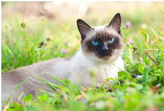
Figura 2: Ejemplo de fotografía

“El primer sujeto del estudio que se esta evaluando es Bigotes , este se presenta en la Figura 2 en la cual se puede notar que pertenece a la raza Siamés y esta acostumbrado a salir a exteriores. Este comportamiento ha provocado que presente múltiples infecciones debido a ... ”