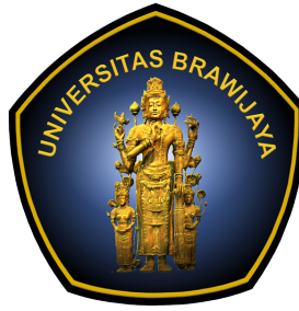
Gambar L2.1 Logo Universitas Brawijaya